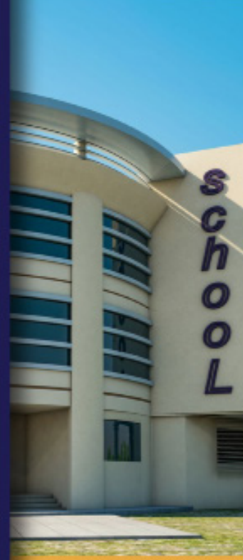
MODERN SCHOOL (بالمنيا)