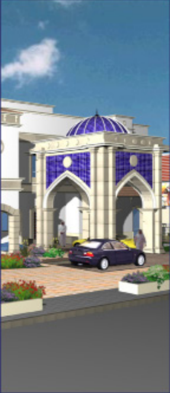
قصر العجو بالرياض