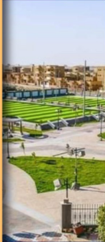
نادي CITY CLUB (بالمنيا)