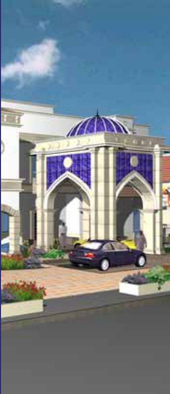
قصر العجو بالرياض