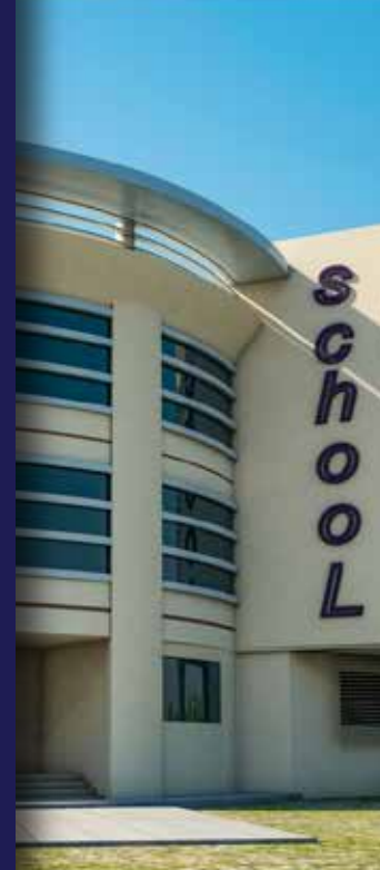
MODERN SCHOOL (بالمنيا)