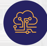
وصلات كهرباء ومياة وصرف