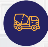
أجود أنواع الخرسانة الجاهزة والحديد المسلح