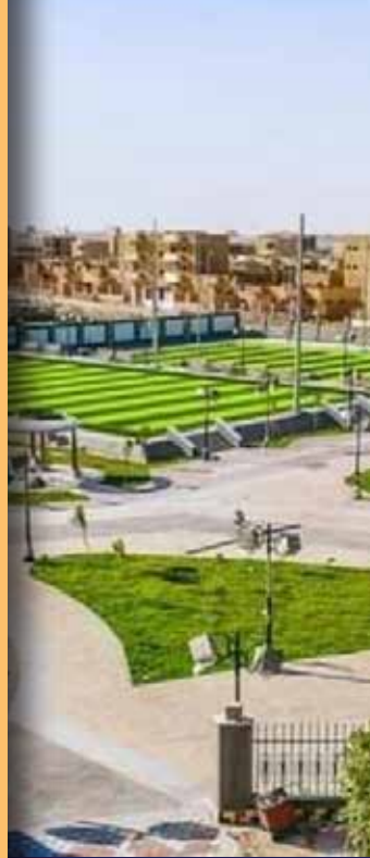
نادي CITY CLUB (بالمنيا)