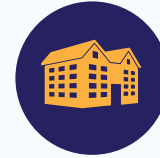
وجهات معمارية متميزة