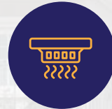
نظام إنذار حريق