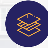
عزل عالي الجودة للرطوبة والحرارة