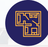
أسقف فلات سلاب