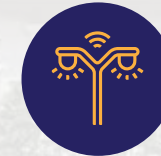
إنارة ذاتية التشغيل