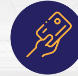
كرت ذكية لدخول المبني