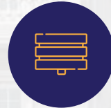
قطعاعات الومنيوم عالية الجودة عازلة للأنربة والضوضاء