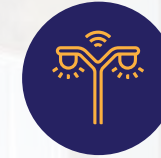
إنارة ذاتية التشغيل