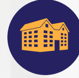
وجهات معمارية متميزة