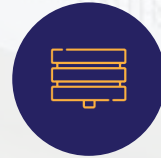
قطعاعات الومنيوم عالية الجودة عازلة للآتربة والضوضاء