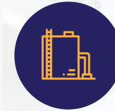
خزانات مياة معالجة