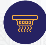
نظام إنذار حريق