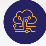
وصلات كهرباء ومياة وصرف