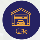
أبواب جراج اليكترونية تعمل بالريموت