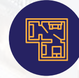
أسقف فلات سلاب