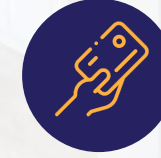
كروت ذكية لدخول المبني